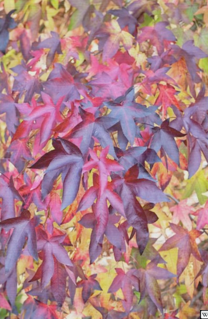
Liquidambar Foliage in Autumn Wood Print Tim Gainey by Tim Gainey Fine Art America

https://fineartamerica.com/featured/liquidambar-foliage-in-autumn-tim-gainey.html?product=wood-print